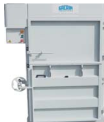
Presskraft 15t Balvikt 100-150 kg Inmatning öppning H:550mm x W:1050mm