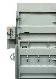
Presskraft 45t Balvikt 400 kg Inmatning öppning H:460mm x B:1200mm 7,5 kW motor