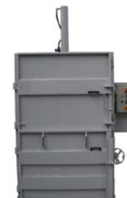
Presskraft 22t -7,5 kW motor Balvikt 300 kg Inmatning öppning H:680mm x B:1200mm