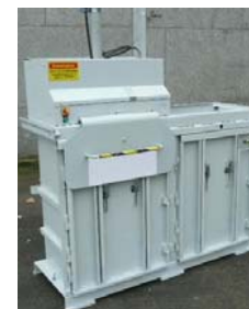
Presskraft 4t 1-Fas 220V Balvikt 50 -60 kg Inmatning öppning L:700mm x B:960mm