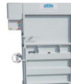
Presskraft 10t Balvikt 70-100 kg Inmatning öppning H:550mm x W:1050mm 1-Fas 220V