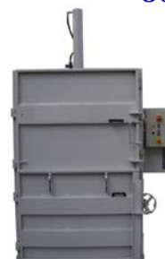
Presskraft 22t -3 kW motor Balvikt 300 kg Inmatning öppning H:680mm x B:1200mm