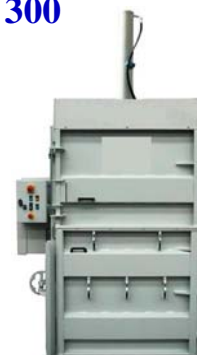
Presskraft 52t -7,5 kW motor Balvikt 500 kg Inmatning öppning H:540mm x B:1200mm