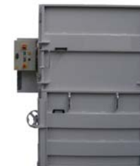
Presskraft 30t Balvikt 300 kg Inmatning öppning H:440mm x B:1200mm 3 kW motor