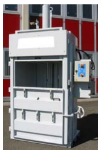
Presskraft 52t - 7,5 kW motor Balvikt 400 kg Inmatning öppning H:540mm x B:1150mm