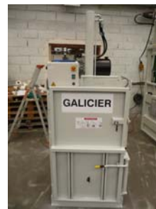
Presskraft 6t 1-Fas 220V Balvikt 70-80 kg Inmatning öppning H:700 mm x B:490 mm