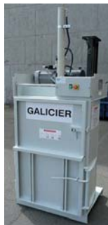
Presskraft 4t 1-Fas 220V Balvikt 40 -60 kg Inmatning öppning H:700 mm x B:490mm

Med våra balpressar kan du vara säker på kvalitet och tillförlitligheten och i kombination med bra pris på utrustningarna har Ni svaret på hur Ni skall förbättra återvinningen och avfallshanteringen.